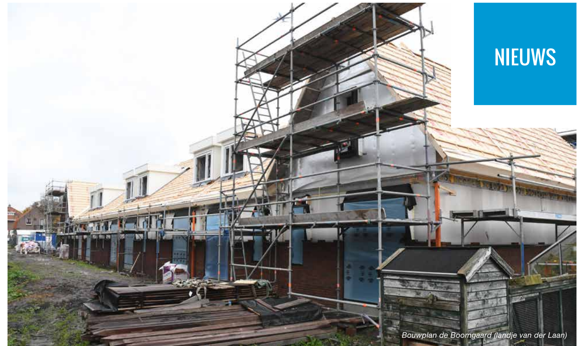
Bouwplan de Boomgaard (landje van der Laan)