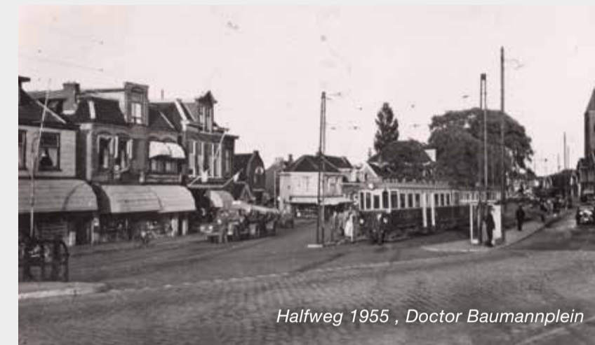
Halfweg 1955, Doctor Baumannplein